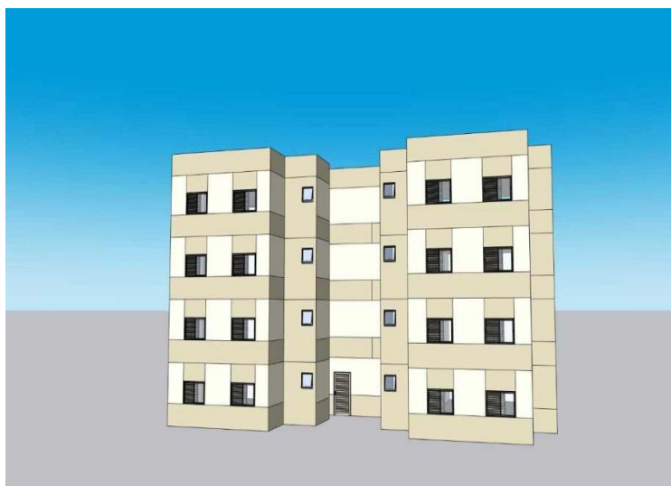
Modelo das Moradias

Além da renda, um dos critérios de seleção é o tempo de residência do grupo familiar, sendo necessário morar em Ubá há pelo menos cinco anos. Outros critérios que aumentam as chances de seleção incluem: mulheres chefes de família; mulheres vítimas de violência doméstica que possuam medidas protetivas; famílias residentes em áreas de risco; idosos; e pessoas com deficiência.