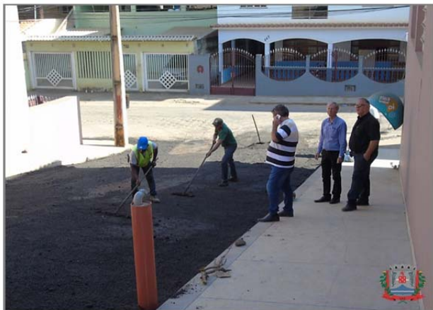
Rua Itaperuna, no bairro Bom Pastor, recebeu pavimentação asfáltica na manhã desta quarta. Obra foi indicada por emenda parlamentar