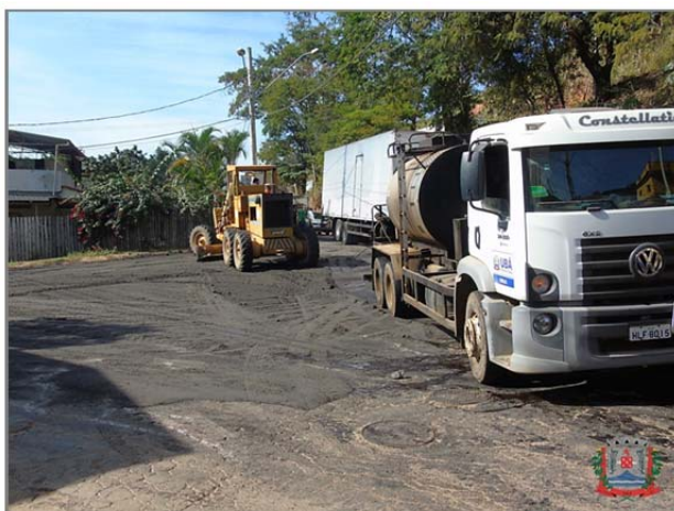
Asfalto no cruzamento das ruas Jurandir Peron e Antônio Elias Laud, no bairro Agroceres, vai trazer mais segurança ao trânsito no local

A Secretaria de Obras realizou, nesta quarta-feira (29), o asfaltamento da rua Itaperuna, no bairro Bom Pastor. Já na quinta-feira (30), a equipe iniciou a pavimentação asfáltica da rua Lauro Nicolato, no bairro Primavera.